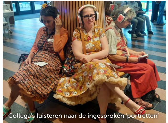
Collega's luisteren naar de ingesproken 'portretten'

Een geslaagde dag die liet zien hoe belangrijk reflectie, begrip en samenwerking zijn in de zorg voor ouderen. Wat ons betreft: graag tot volgend jaar!