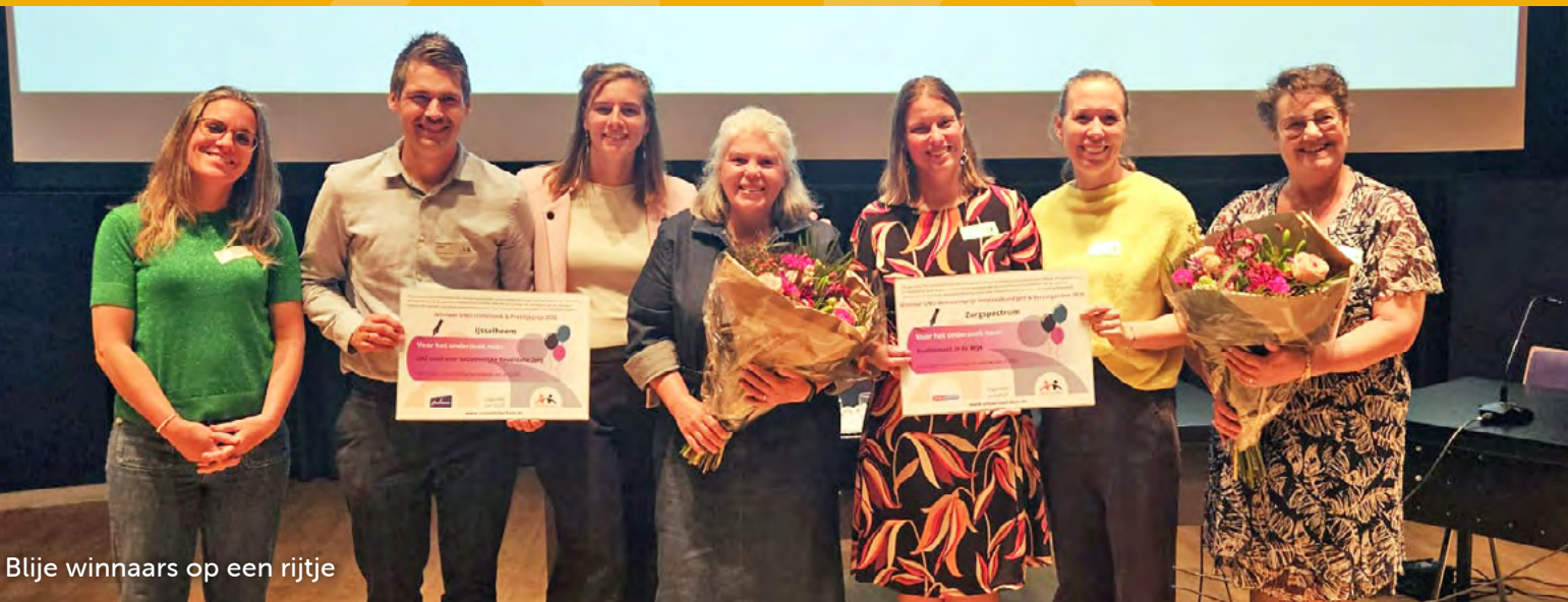
Blijde winnaars op een rijtje

Editie 18 | Voorjaar 2026 | Universitair Netwerk Ouderenzorg Amsterdam